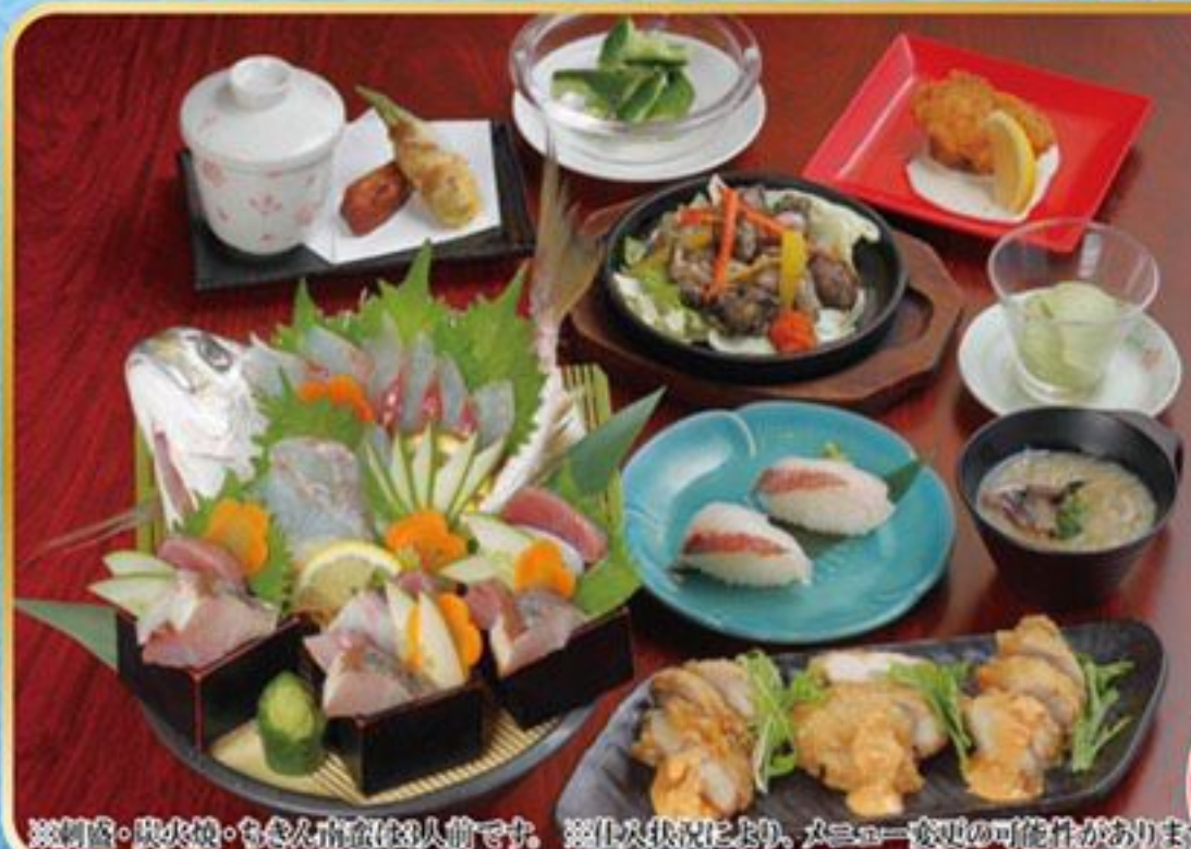
※刺身・炭火焼・ちきん南蛮は3人前です。※仕入状況により、メニュー変更の可能性があります。

※週末3,500円コースは、弊社ホームページorホットペッパーにてご確認ください。 ※仕入状況により、メニュー変更の可能性があります。