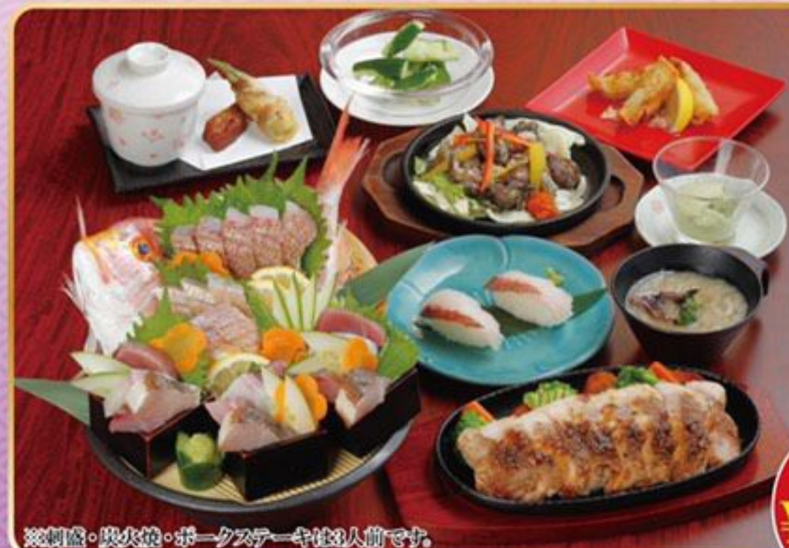
※刺身・炭火焼・ポークステーキは3人前です。

料理のみ ¥2,500 (税込) ¥3,000 (税込) 2時間制 (ソフトドリンク90分飲み放題付)