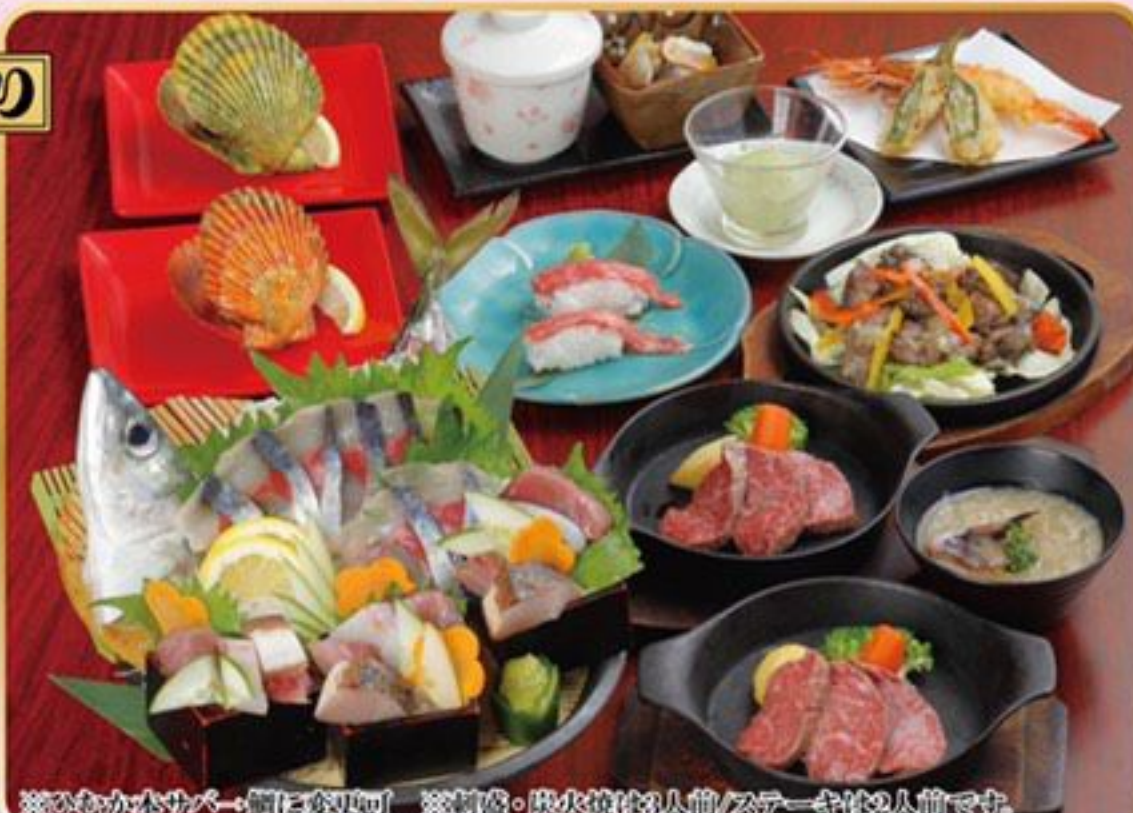
※ひむか本サバ・豚に変わ可 ※刺身・炭火焼は3人前/ステーキは2人前です。