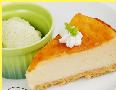
自家製 濃厚チーズケーキ 緑茶ムース添え