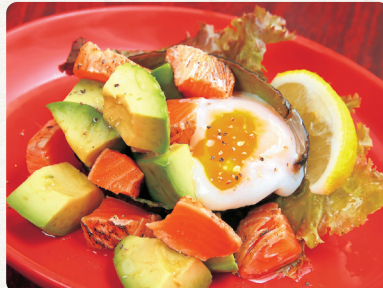
炙りサーモンと アボカドのユッケ 税抜 温泉玉子を混ぜて 680