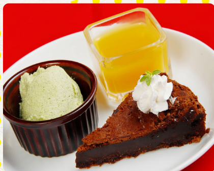
自家製 デザート 3点盛り Dessert Assortment 甜點三拼 税抜 450