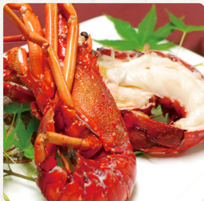
伊勢海老の 塩焼 タルタル添え