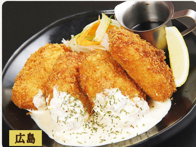
広島 かき 真牡蠣の豚巻きタルタル 税抜 Deep-fried Pacific Oyster wrapped in Pork with Tartare Sauce 680 炸猪五花牡蠣捲佐韃靼醬