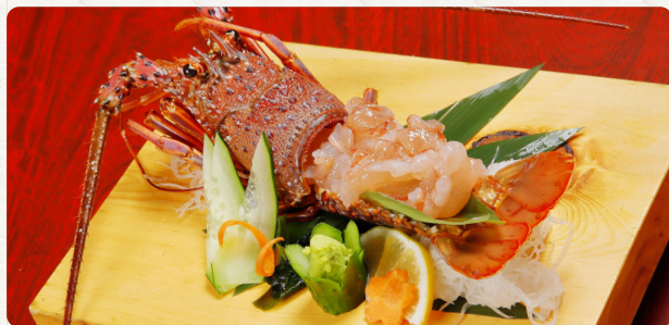
伊勢海老の 姿造り 味噌汁 4人分付 2,800 税抜 3,500 税抜