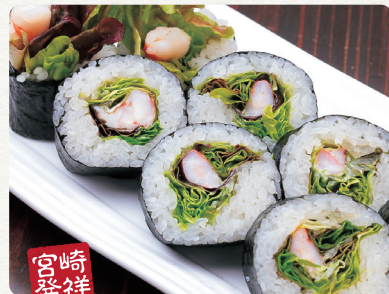
宮崎発祥 海老レタス巻 550 税抜 Shrimp & Lettuce Roll 蝦仁生菜壽司捲