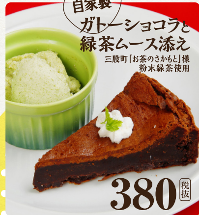
自家製 ガトーショコラと 緑茶ムース添え 三股町「お茶のさかもと」様 粉末緑茶使用