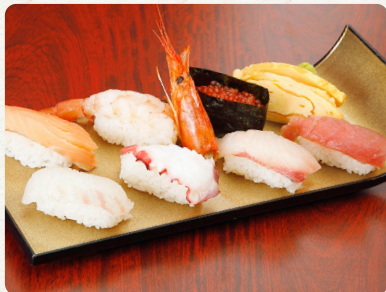
日向灘寿司 780 税抜 english chinese