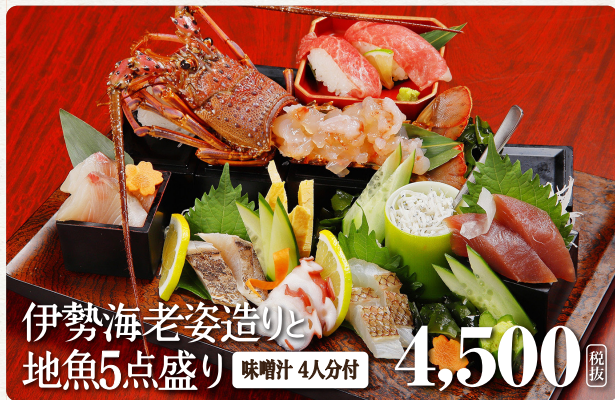
伊勢海老姿造りと 地魚5点盛り 味噌汁 4人分付 4,500 税抜

9月～12月15日までの期間は 基本的に活メにてご提供させていただきます。 (仕入れが困難な場合、活メ急速凍結伊勢海老の可能性もございます) それ以降は活メ急速凍結したものを使用致します。 4月以降は禁漁の為、商材が無くなる可能性がございます。