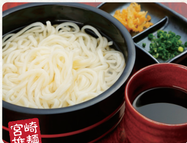
宮崎推麺 釜揚げうどん 550 税抜 Udon Noodles with Dipping Sauce 釜揚げ烏龍麵～附麵沾醬