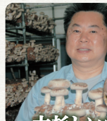
大杉しいたけ園 様