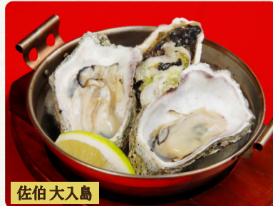
佐伯 大入島 かき 真牡蠣のかんかん蒸し 税抜 3個 780 Steamed Pacific Oyster 蒸牡蠣 税抜 1個 280