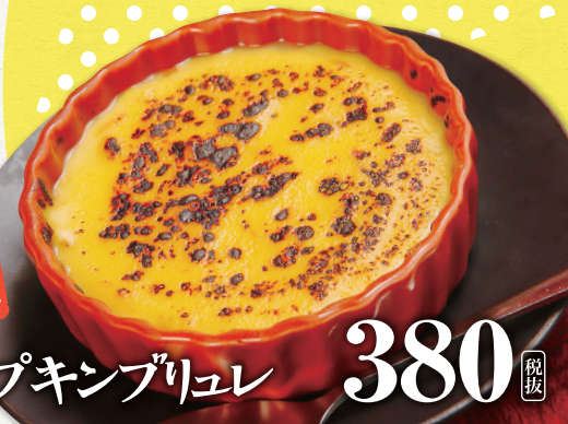
パンプキンブリュレ 380 税抜