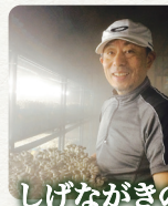
しげながきのご園 様