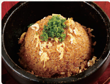
黒毛和牛 牛脂 ガーリックライス 480 税抜 english/chinese