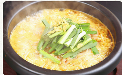
宮崎B級グルメ 辛麺 680 税抜 Spicy Noodles / 辛辣麵