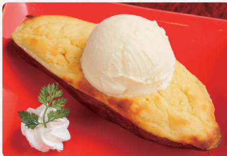
宮崎紅さつもの丸ごとスイートポテト バニラアイスのをせて