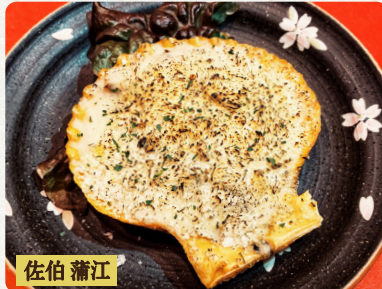
佐伯 蕭江 ひおうぎ 殻付緋扇貝のグラタン 税抜 1個 480