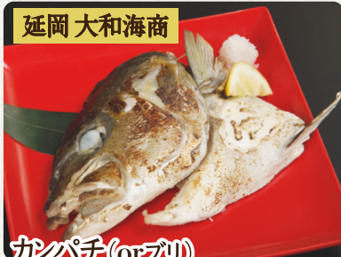
延岡 大和海商 カンパチ(orアジ) カマカブト焼き 税抜 Grilled Yellowtail head or Amberjack head (depending on season) 680 炭烤鱈魚頭或紅魷魚頭(依季節)