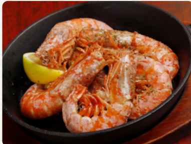
赤海老の ガーリックシュリンプ 税抜 680