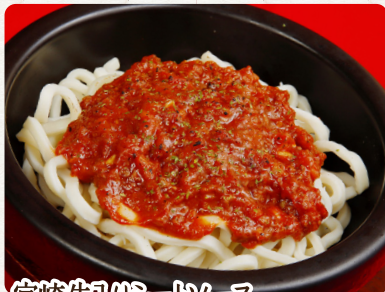
宮崎牛スリミートソース 肉うどん 680 税抜 Udon Noodle with Miyazaki-beef Meat Sauce 宮崎和牛肉醬烏龍麵